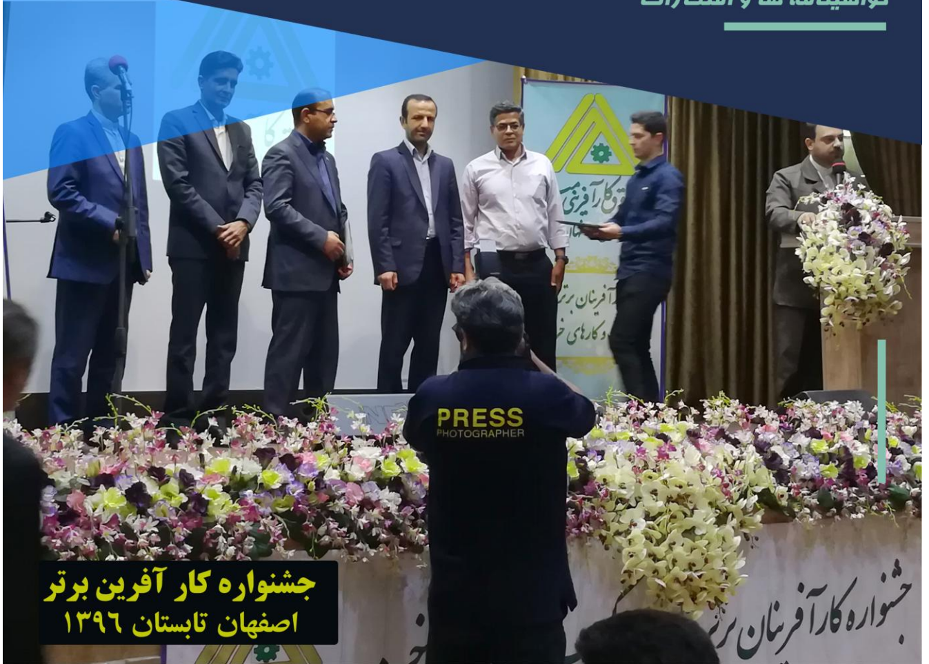
جشنواره کار آفرین برتر اصفهان تابستان ۱۳۹۶